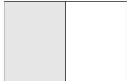
1 / 1 SEITE ABFALLEND Format 215 x 280mm + 3mm Überfüller Preis: € 1.800,00