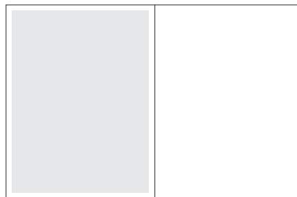
1 / 1 SEITE SATZSPIEGEL Format 195 x 260mm Preis: € 1.800,00