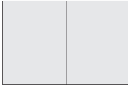
2 / 1 SEITE ABFALLEND PANORAMA Format 430 x 280mm + 3mm Überfüller Preis: € 3.000,00

FRAGEN SIE AUCH NACH WEITEREN ANZEIGEMÖGLICHKEITEN WIE Z.B. IN UNSEREM KULTUR- UND EVENTKALENDER