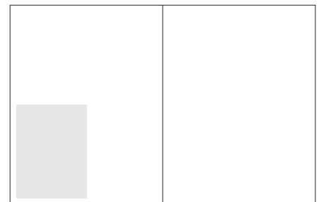
1 / 4 SEITE HOCH SATZSPIEGEL Format 95,5 x 128mm Preis: € 500,00